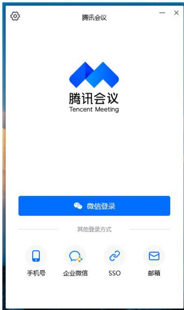
图 1 注册登录