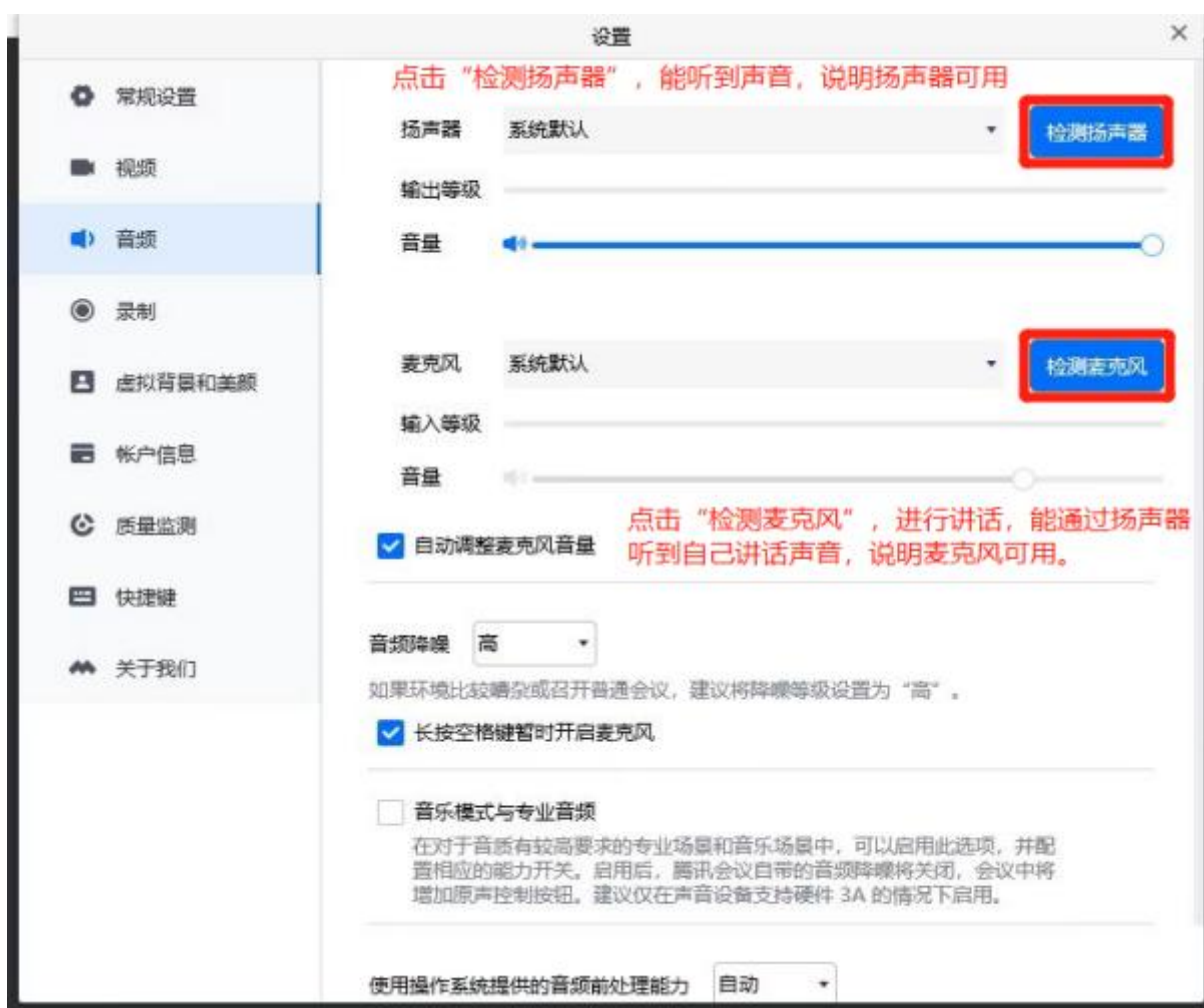
图 6 测试音频