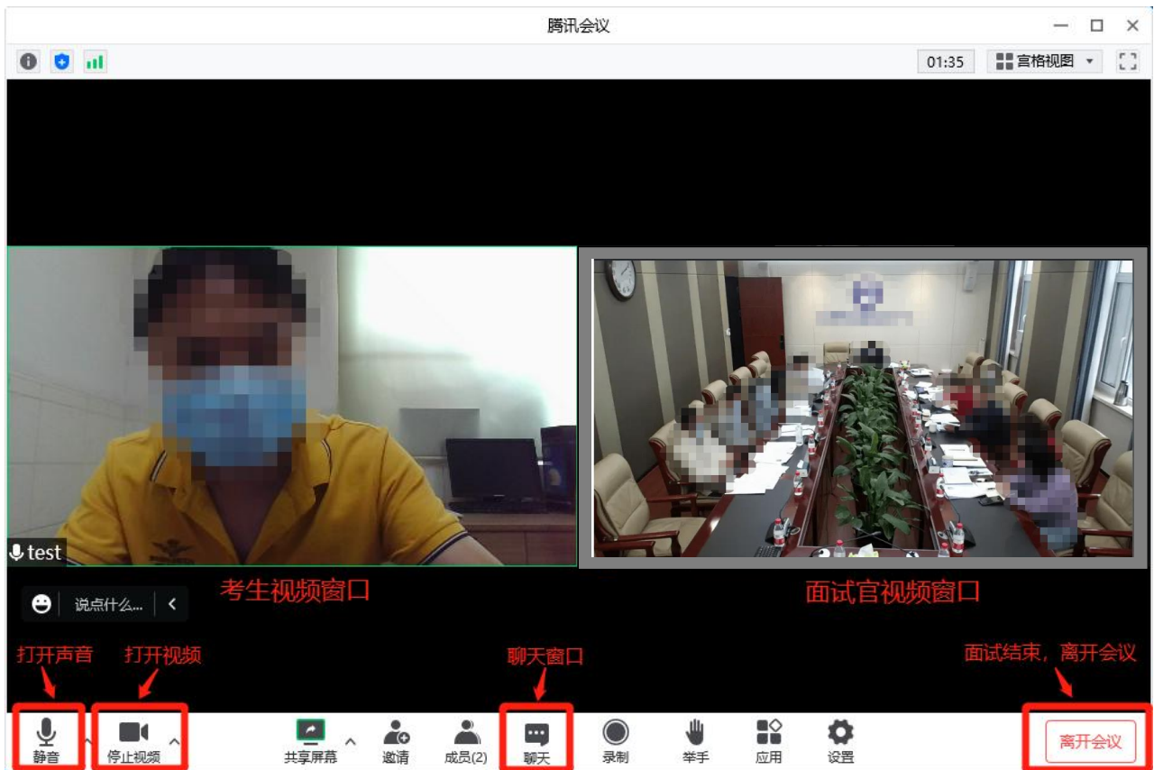
图 8 面试会议界面

注意：如果是使用电脑设备面试，首次使用腾讯会议时，软件会弹出如图 9 界面。考生要勾选“入会时使用电脑音频”点击“使用电脑音频”。