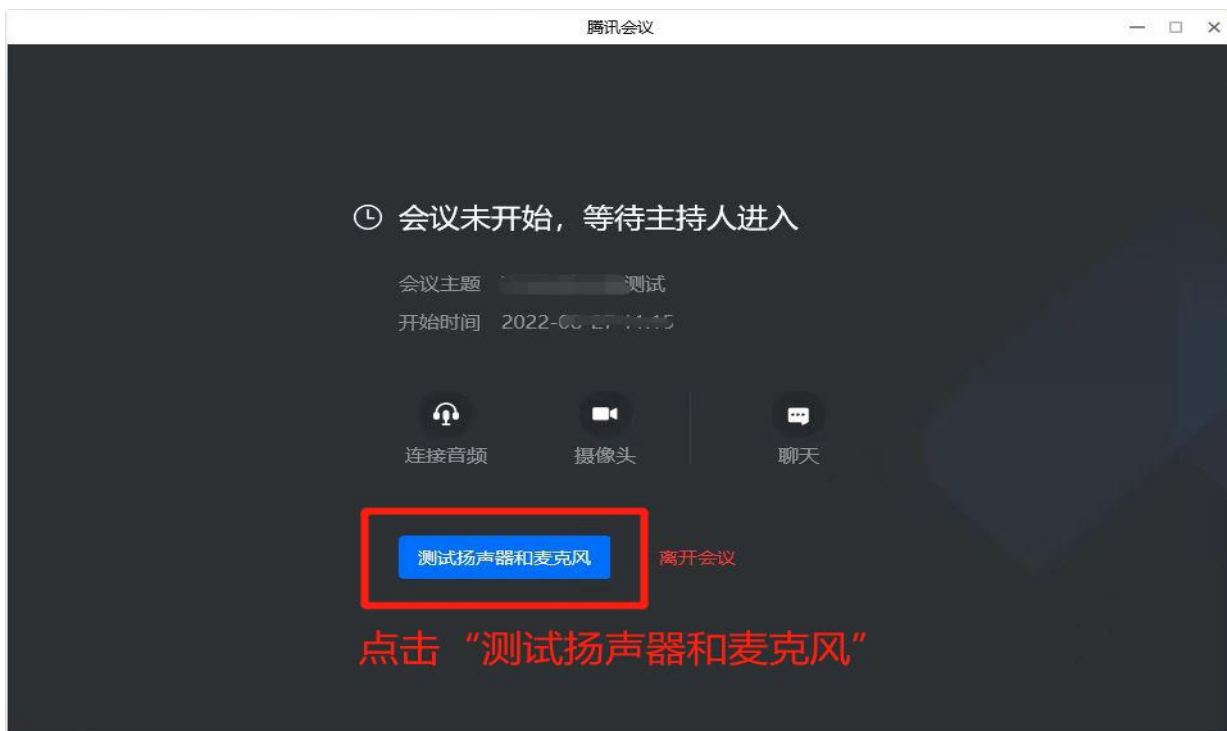
图 5 等候室界面