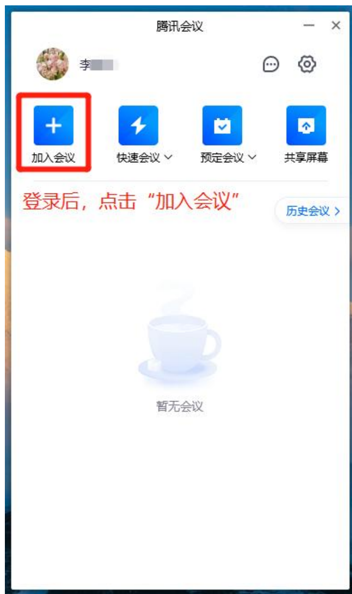
图 2 加入会议

输入会议号和真实姓名(不是考生, 不允许进入会议)。会议设置中的【自动连接音频】、【入会开启摄像头】和【入会开启麦克风】都需要勾选上, 然后点击"加入会议", 如图 3 所示。