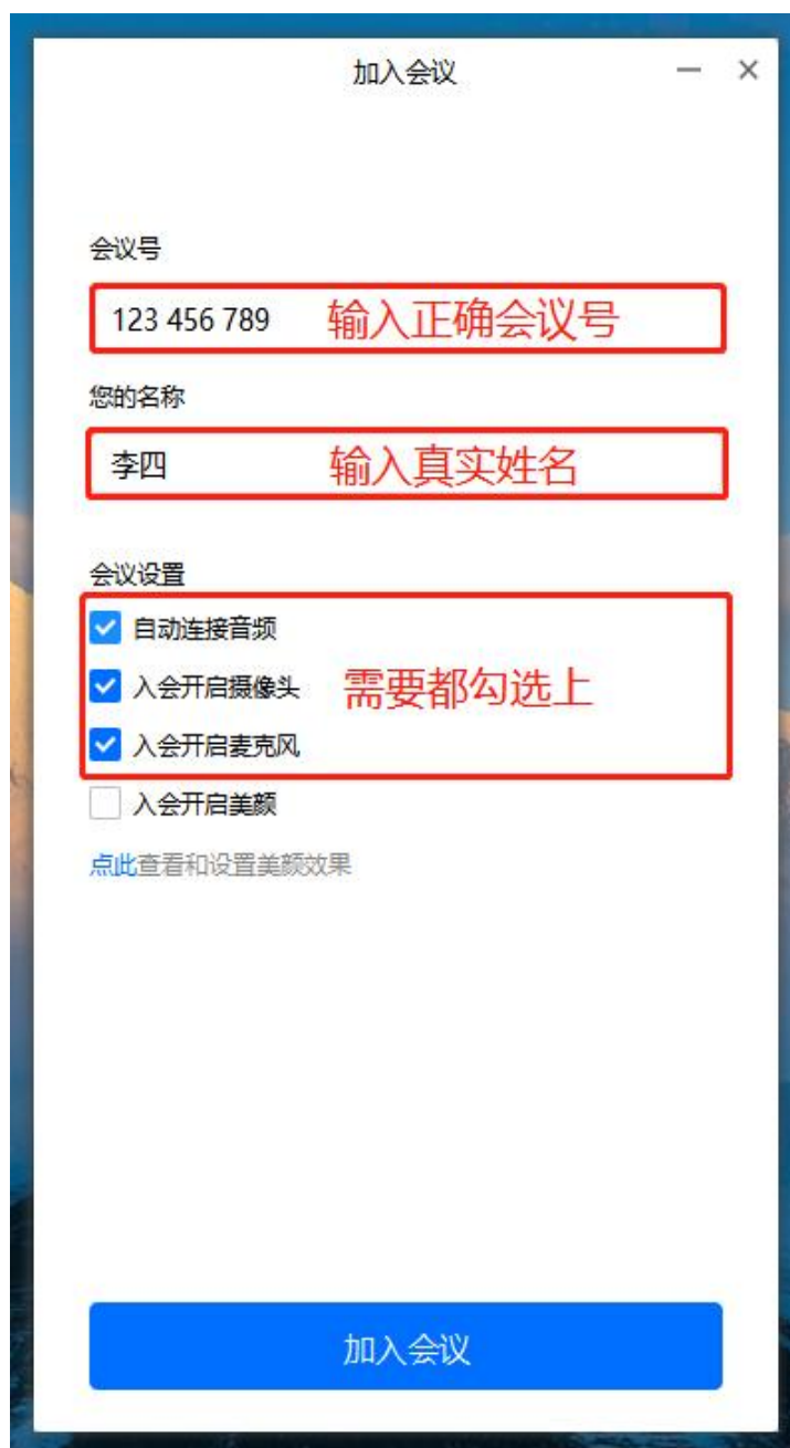
图 3 输入会议号等