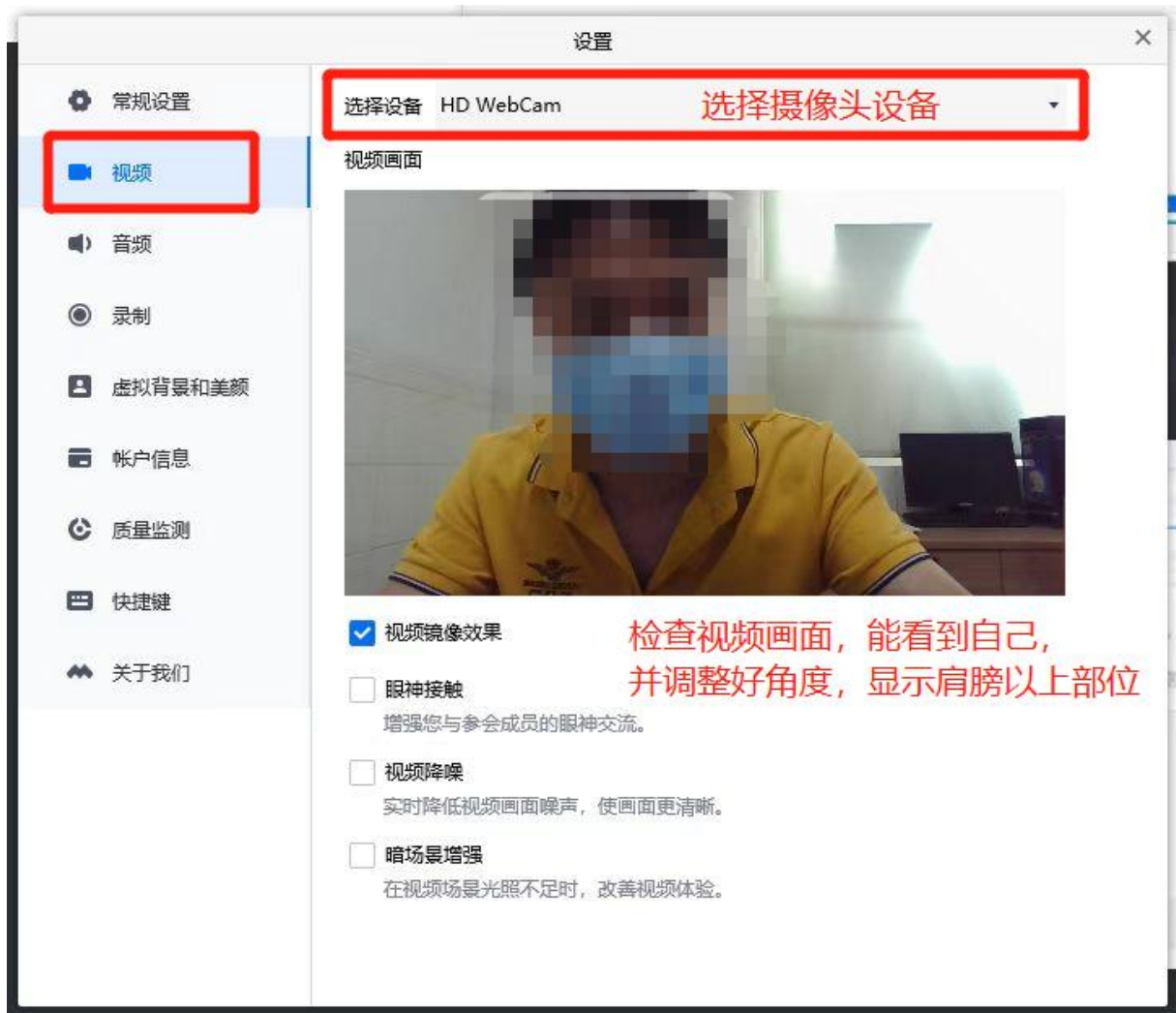
图 7 测试摄像头